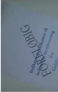
Indikatorspecifikation til boligsocial monitoring for Guidborgsund Kommune