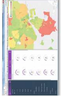
FLIS på Fyn